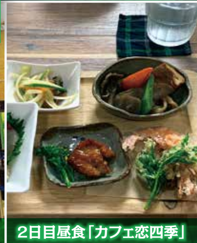
2日目昼食「カフェ恋四季」