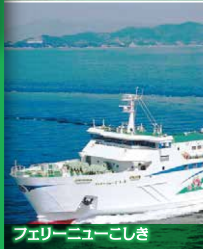
フェリーニューこしき