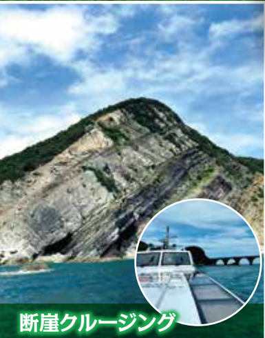
断崖クルージング