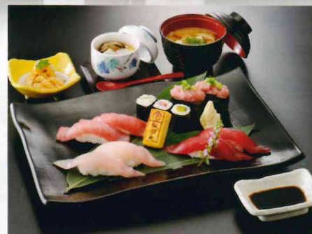
特盛り寿司セット 1,800円

上記料理以外にも、まぐろ料理の食材をふんだんに使用したメニューの数々をご用意しております。