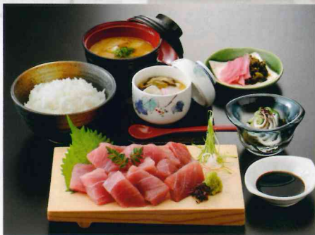
まぐろぶつ切り定食 1,200円