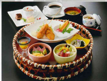
松榮丸 彩レディースセット 1,700円