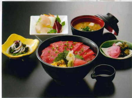
元祖 まぐろ丼 800円